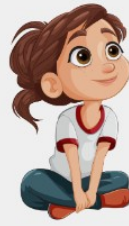
sitzen / das Mädchen