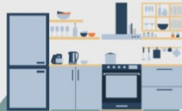
in der Küche